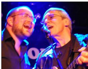
Massachusetts rend hommage aux Bee Gees.